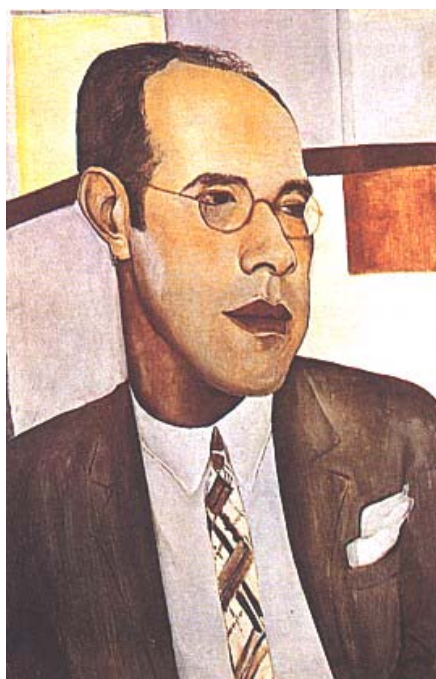
Mário de Andrade por Lasar Segal

Um livro como este não comporta discussão de problemas gerais do ritmo. Basta verificar que estamos numa fase de predominância rítmica. Neste capítulo o principal problema para nós é o da síncopa.